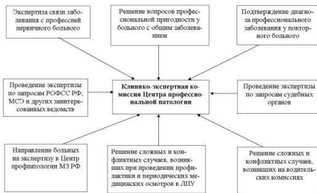
Рис.4 Структурная схема функций клинико-экспертной комиссии Центра профпатологии

Выбранная структурно-функциональная организация службы позволит реализовать современные комплексные программы сохранения здоровья работающих на предприятиях Воронежской области. Такой программой, в рамках которой ЦПП осуществляет свою деятельность во взаимодействии с рядом заинтересованных областных структур, является «Областная целевая программа улучшения условий и охраны труда на 2004 - 2006г.г.»