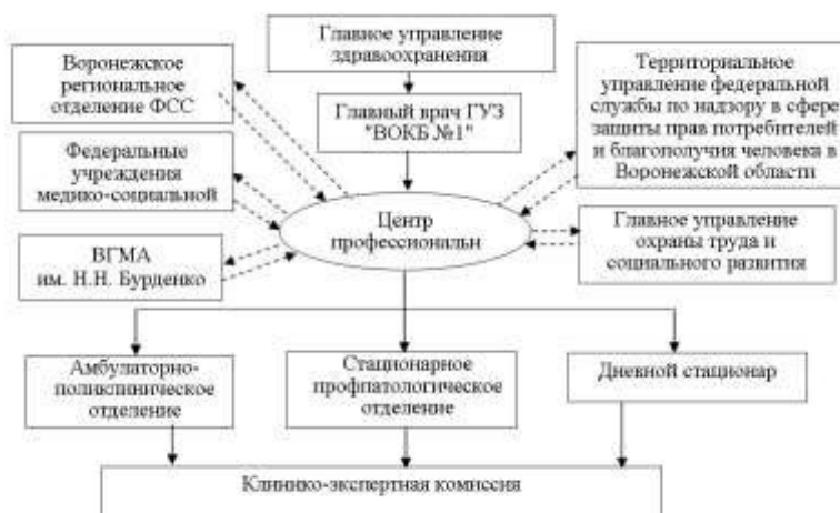
Рис. 2. Структурная схема построения Центра профессиональной патологии и его взаимодействия с другими ведомственными службами.

Была выбрана оптимальная модель организации ЦПП в составе областной больницы, способного организовывать и координировать всю работу по вопросам профессиональной патологии в регионе. Центр профессиональной патологии является организационно-методической, консультативной, диагностической, лечебной и образовательной структурой, объединяющей и координирующей работу всех служб по выявлению, диагностике, профилактике профессиональных заболеваний и осуществлению реабилитации больных, работающей в тесном взаимодействии с региональным отделением Фонда социального страхования, Федеральными органами контроля и надзора, Главным управлением охраны труда администрации области, МСЭ (рис.2).