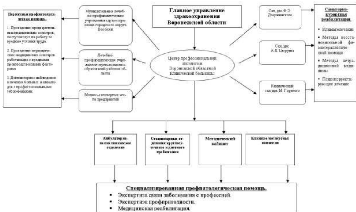
Рис. 1. Структурная схема региональной службы профессиональной патологии.

Была выбрана оптимальная модель организации ЦПП в составе областной больницы, способного организовывать и координировать всю работу по вопросам профессиональной патологии в регионе. Центр профессиональной патологии является организационно-методической, консультативной, диагностической, лечебной и образовательной структурой, объединяющей и координирующей работу всех служб по выявлению, диагностике, профилактике профессиональных заболеваний и осуществлению реабилитации больных, работающей в тесном взаимодействии с региональным отделением Фонда социального страхования, Федеральными органами контроля и надзора, Главным управлением охраны труда администрации области, МСЭ (рис.2).