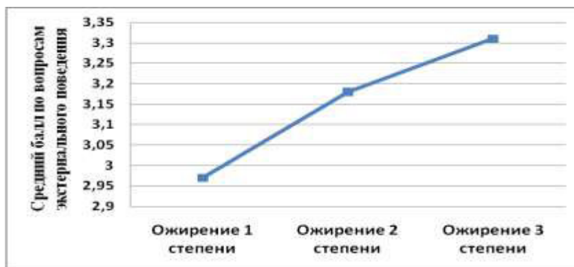
Рис. 3. Зависимость среднего балла экстернального поведения от степени ожирения.

по вопросам эмоциогенного поведения имели 24,6% пациентов. Значения баллов по трем типам пищевого поведения оказались выше нормальных у 14,8 % обследованных.