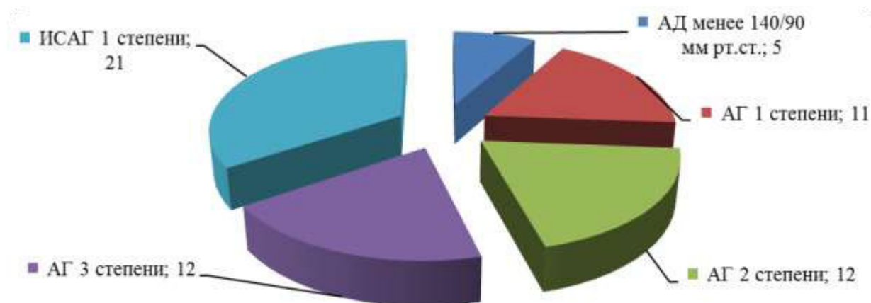
Рис. 2. Распределение пациентов в зависимости от уровня АД

Средний уровень артериального давления составил 140/85 \pm 17 мм.рт.ст., что соответствует 1-й степени артериальной гипертензии (рис. 2).